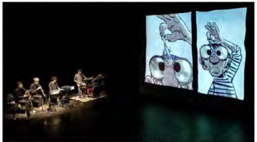
Un océan d'amour, une BD mise en musique par le groupe Zenzika, invité par la bibliothèque de Briançon.