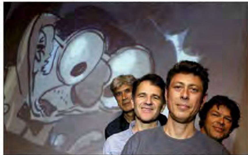
Le ciné-concert "Un océan d'amour" sera présenté demain à 20h30 au théâtre du Briançonnais.

« Pour un "Océan d'amour", c'est essentiellement le pianiste qui a composé les grands thèmes musicaux. Nous nous sommes ensuite retrouvés ensemble pour les arrangements et reprendre les mélodies. Chacun ensuite ajoute ses idées. Nos influences sont plutôt tournées vers le jazz, mais notre pianiste ayant fait 15 ans de